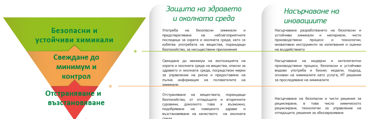
Фигура: Йерархия на нетоксичността — нова йерархия в управлението на химикалите

Почти 20 години след първия стратегически подход към управлението на химикалите в Европа 18 настъпи моментът да се очертае нова дългосрочна визия за политиката на ЕС в областта на химикалите . В съответствие с Европейския зелен пакт стратегията се стреми към нетоксична околна среда, в която химикалите се произвеждат и използват по начин, който оптимизира приноса им за обществото, в това число осъществяването на екологичния и цифровия преход, като същевременно предотвратява вредите за планетата и за настоящите и бъдещите поколения. Тя предвижда промишлеността на ЕС да се превърне в конкурентоспособен в световен мащаб участник в производството и употребата на безопасни и устойчиви химикали . Стратегията предлага ясна пътна карта и график за преобразуването на промишлеността с цел привличане на инвестиции в безопасни и устойчиви продукти и производствени методи.